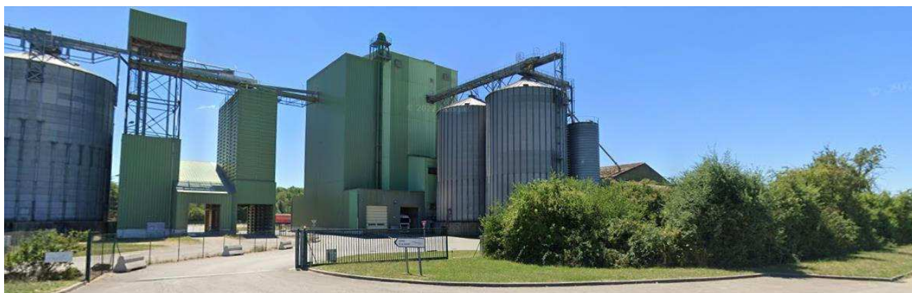
Photo 2 vue arrière de DNA depuis le Chemin de la Voie ferrée au Nord (ci-dessus) – Juillet 2022