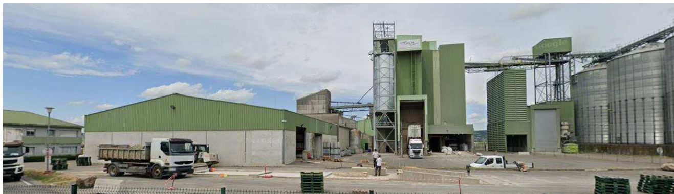
Photo 1 vue face à DNA depuis la RD 519 au Sud (ci-dessus) – Mai 2022