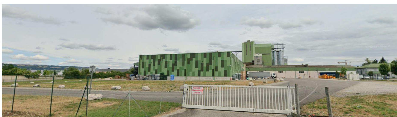
Photo 3 vue du site depuis la rue du Char de Bronze à l'Ouest (ci-dessus) – Mai 2022